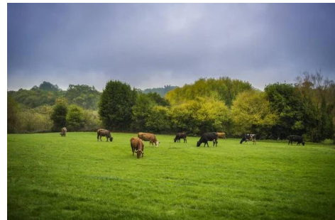
vaca rubia gallega

e) Producto final: Elaboración de un power point de forma individualizada, por parte del alumnado.