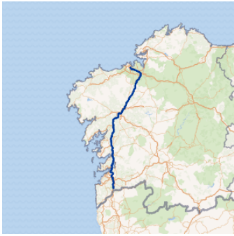
Autopista del Atlántico