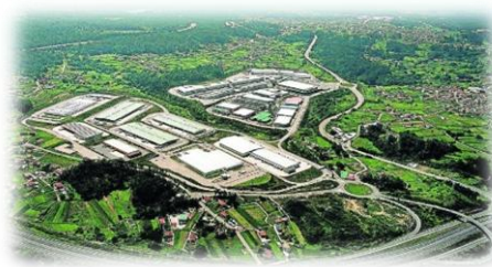
Parque tecnológico y logístico de Valladares ( Vigo)