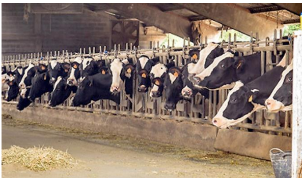
Granja producción lechera