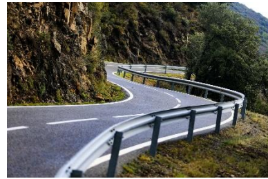
Carretera del interior gallego