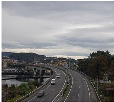
imagen autopista del Atlántico