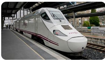
Tren de alta velocidad